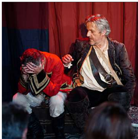
Le Cantique des Pirates