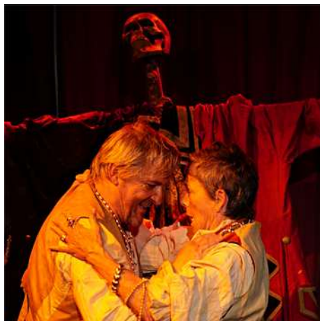
Le Cantique des Pirates