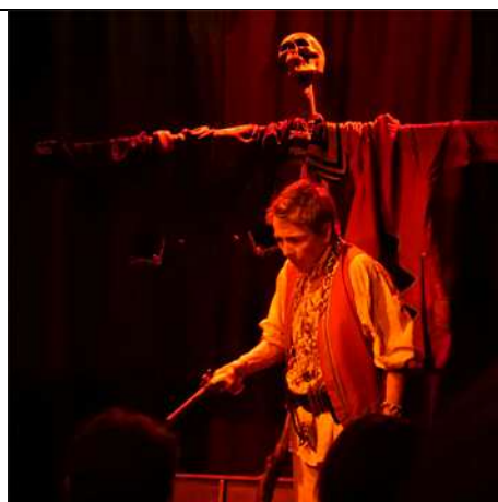
Le Cantique des Pirates